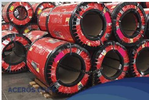
Lámina recubierta por el proceso de inmersión en caliente, a la cual se le aplica un recubrimiento de zinc, apta para aplicaciones en el segmento Construcción. Disponible en Negra, Zintro, Zintroalum y Pintro. El acero que se utiliza para la construcción de estructuras metálicas y obras públicas, se obtiene a través de la laminación de acero en una serie de perfiles normalizados.

El proceso de laminado consiste en calentar previamente los lingotes de acero fundido a una temperatura que permita la deformación del lingote por un proceso de estiramiento y desbaste que se produce en una cadena de cilindros a presión llamado tren de laminación. Estos cilindros van formando el perfil deseado hasta conseguir las medidas que se requieran.